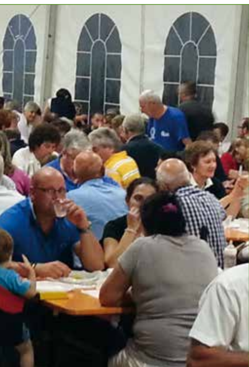
Rosse e domenica 30 con l'orchestra Harmony. Nella giornata di domenica,

inoltre, torneo calcistico a partire dalle 9.15, con premiazioni nel tardo pomeriggio, e a seguire, intorno alle 12.30, pranzo (su prenotazione).