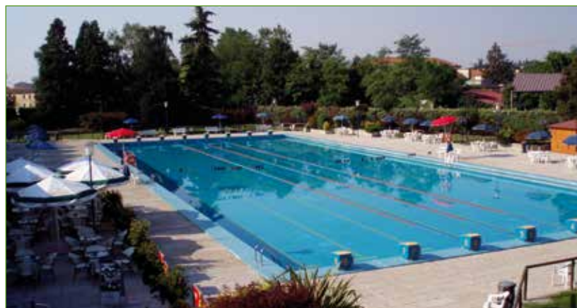
A sinistra: la piscina esterna comunale di Vittorio Veneto