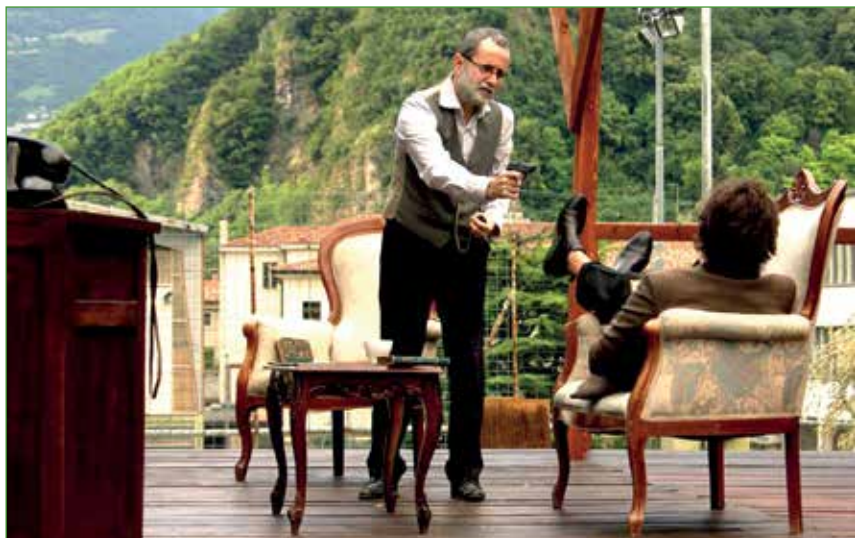
Lo spettacolo "L'ospite"

da attori si sono trasformati in pittori e falegnami».