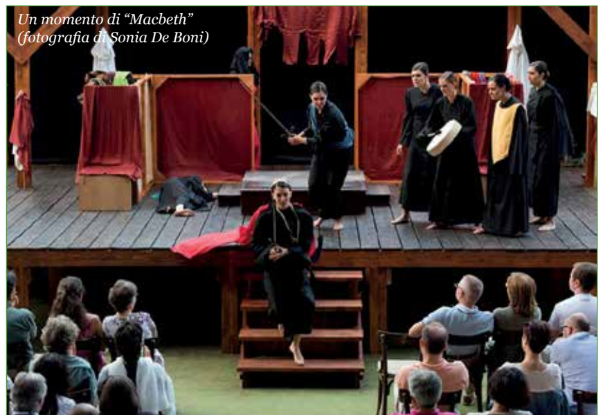
Un momento di "Macbeth"