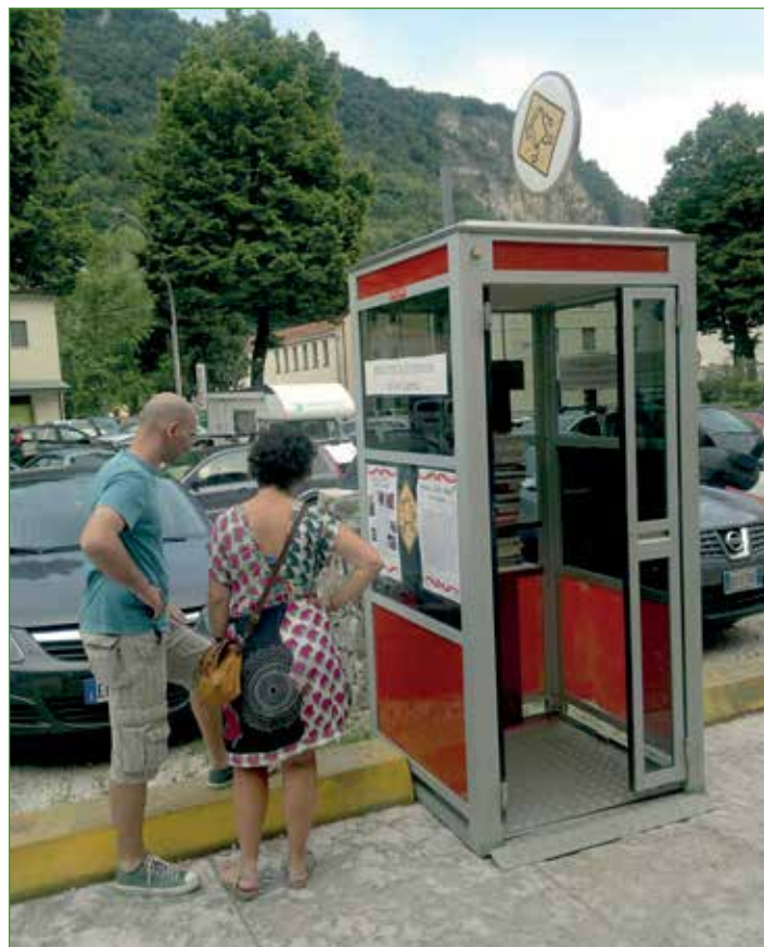
La cabina letteraria di Via Caprera