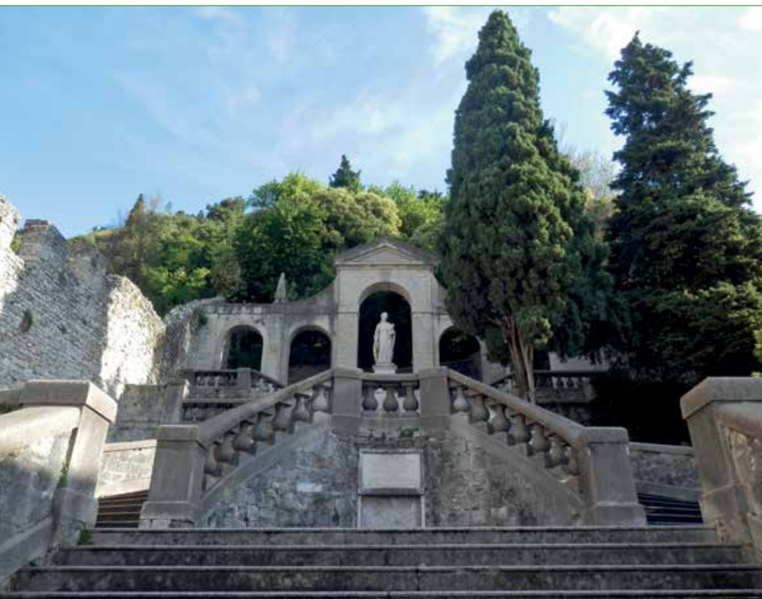
La scalinata di Santa Augusta a Serravalle